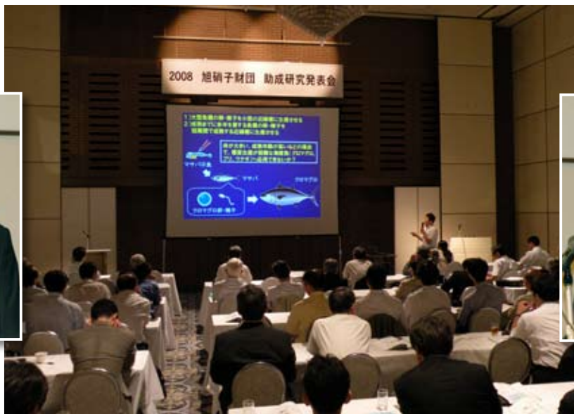
3分間スピーチ発表会場